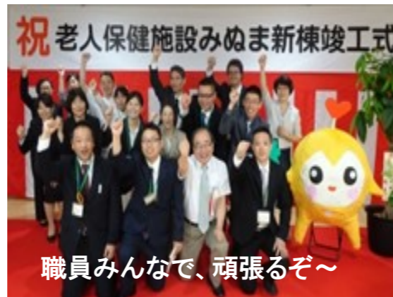
祝 老人保健施設みぬま新棟竣工式 職員みんなで、頑張るぞ～