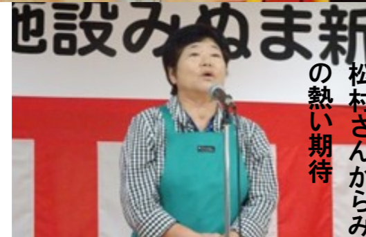
松村さんからみぬまへの熱い期待