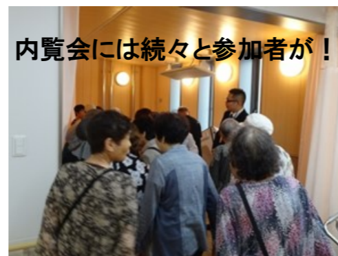
内覧会には続々と参加者が！