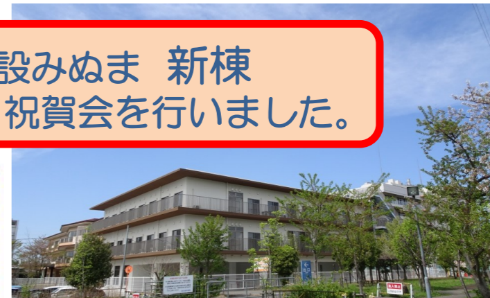
2017年8月1日 老人保健施設みぬま建設委員会 作成

組合員と職員・地域の皆さんで作りに上げてきた老健みぬまの増築棟が完成しました。この度、7月30日（日）、老人保健施設みぬま新棟竣工式・祝賀会を行いました。合わせて、増築棟に利用者さんを受け入れる前の、最後の内覧会も開催しました。