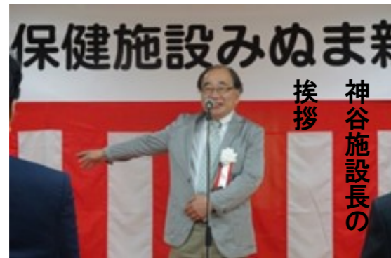
神谷施設長の挨拶