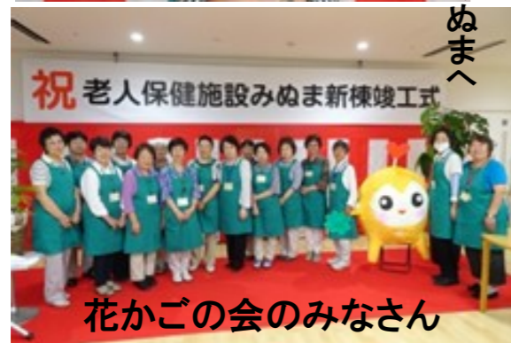
祝 老人保健施設みぬま新棟竣工式 花かごの会のみなさん