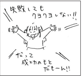
秩父市・ありあ(50代)