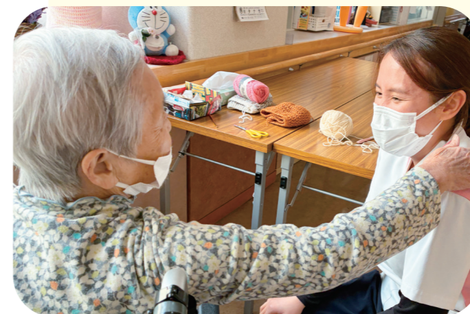
「あなたたちは希望なのよ！」と利用者さんに励まされるイーさん

日本語は難しく、仕事に慣れるまでは大変でした。はじめは先輩たちに助けてもらいましたが、今では1人で対応できるようになりました。将来は介護福祉士の資格を取り、日本で長く働きたいです。