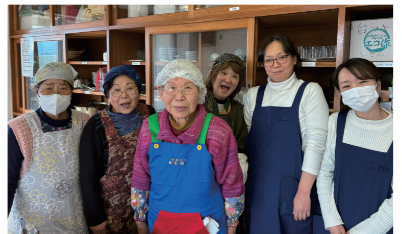
当日のメニューを考えてくださった2人の調理師と運営委員でパチリ！

昨年度は「健康まつり」や「秩父生協病院創立70周年記念式典」をはじめ、イベントや訪問行動で声をかけ、9人が加入して目標を達成しました。支部の『けんこうと平和』の配付率は80%以上です。配付者のつどいでは、フレイル学習や笑いヨガ、ポッチャ大会などで交流を深めています。