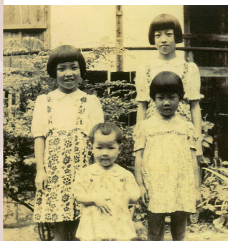
四姉妹。後列右が筆者

体験談や聞き書きの投稿をお待ちしています(約800文字)。応募先は11ページをご覧ください。