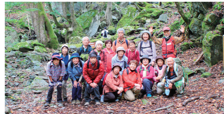
奥秩父にある入川渓谷を歩きました。中には90歳代の参加者も！

毎月第4木曜日の9時から開催しているのが「ミューズパークウォーキング」。秩父市と小鹿野町にまたがる大きな公園内のさまざまなコースを3kmほど歩きます。支部や地区合同で入川渓谷を歩くこともあり、外出を控えがちな人にもよい運動になると好評です。