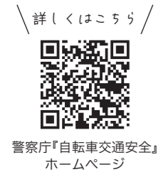
警察庁「自転車交通安全」ホームページ

青切符とは？ 軽微な交通違反をした際に交付される「交通反則切符」のこと。反則金を納付すれば、刑事罰を受けずに手続きが終了する。