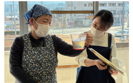
秩父生協病院の調理師を講師に作ります