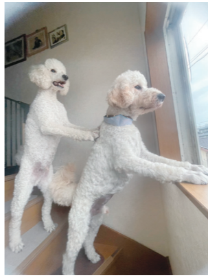
何が見えるの!? 戸田市・いぼこ(20代)