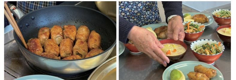
2月のメニューは厚揚げの肉巻き、水菜のごま味噌和え、豆乳スープなど。食塩相当量は2.0g

年に2回開催している「健康料理教室」は15年ほど前、地区での郷土料理作りをきっかけに始まりました。すこしおメニューで作り、塩を入れなくても野菜がきれいに茹でられるなど、習慣で使っていた塩分を減らせると好評です。どのメニューもおいしく手軽なので、毎日の食事にも活かせるのがよいところ。「ここに来て食事を見直したら血圧が下がった」という人もいます。