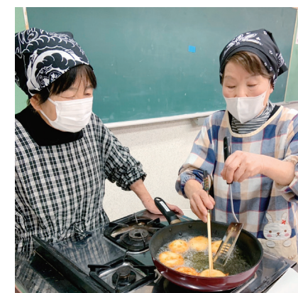
ゼリーフライを揚げているようす