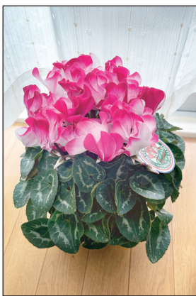
所沢市・ふくみん(70代)

お友だちにいただいたシクラメン。小さなめのガーデンシクラメンを見慣れていたのでも、とても豪華に感じます。寒い冬も、元気に長く咲いてくれますように！