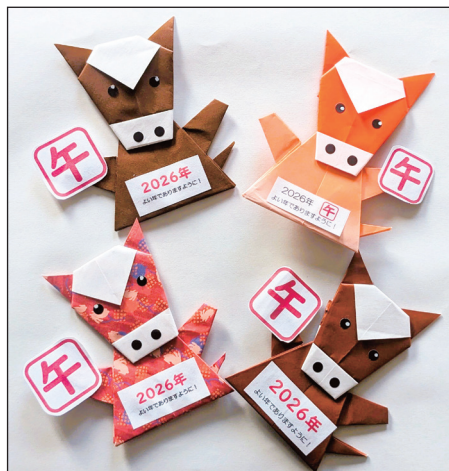
春日部市・うまっち(70代)