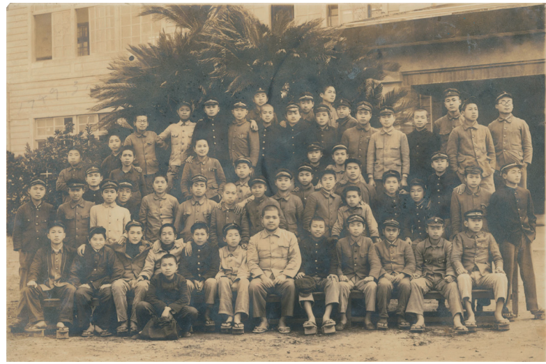
旧制中学校の写真。栄養状態が悪く小柄でした。前列右から2番目が筆者。