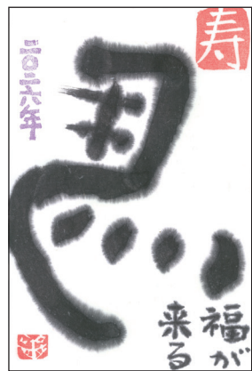
久喜市・千両万両(60代)