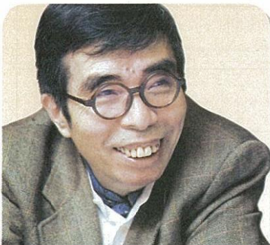
井上ひさし 作家・劇作家