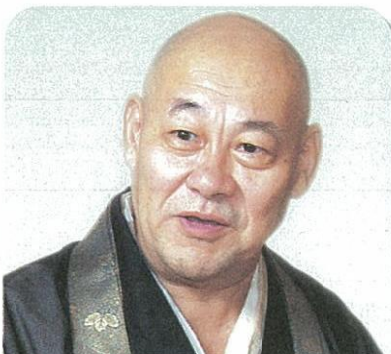
有馬頼底 臨濟宗相国寺派管長 金閣寺・銀閣寺住職