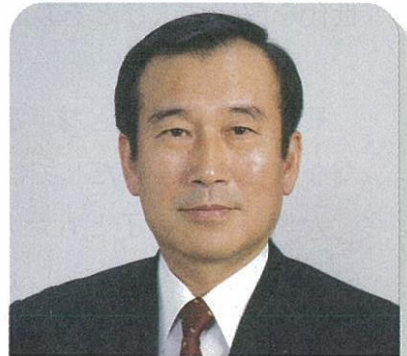
秋葉忠利 広島市長