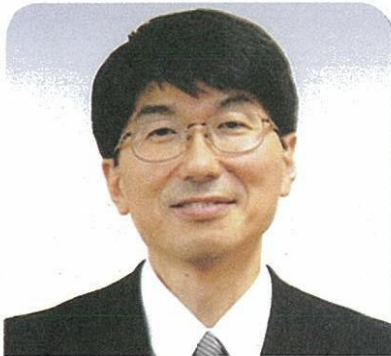
田上富久 長崎市長