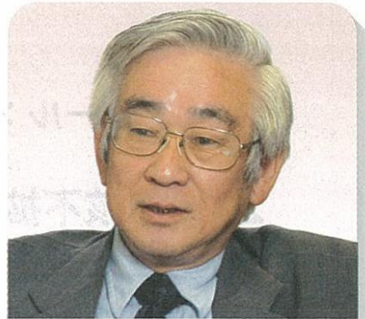
益川敏英 京都産業大学理学部教授