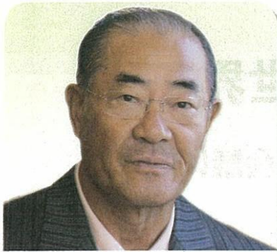
張本 勲 日本プロ野球名球会