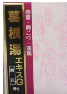
葛根湯エキスG(顆粒) 6包入り(二日分) 630円

邪気(風邪ウイルス)はまず体の表面に留まるとされるので、この段階で汗をかかせ、内部へ侵入する前に体表から邪気を取り払おうと考えます。そくそくと寒気がする。首筋や背中がこる。頭痛や筋肉の痛みがある。このような風邪の初期症状の段階で威力を発揮するのが葛根湯です。このタイミングでお湯に溶いて飲み、消化の良いお粥などを食べ早く寝れば、じわっと汗をかき、翌日には身体もすっきりとします。